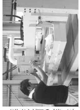
畳表を畳床へ熱圧着