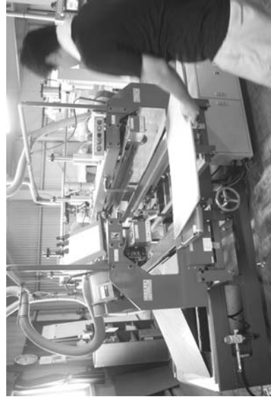
高圧裁断機での切作業

として、新しい事業を發表した。畳工事の仕事を受注するのではなく、あくまでも畳屋さんの仕事の手伝いと位置付ける。新事業にあたっては、経済産業省から経営力向上計画の認定を受けている。